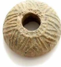
Roman lead spindle whorl.